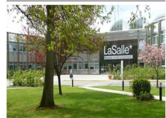
La Salle Beauvais fait partie des établissements labellisés DD&RS en mai 2016.

Le comité de labellisation DD&RS a récompensé mi-mai 2016, huit écoles et deux universités pour leur engagement dans le développement durable et la responsabilité sociétale. Une première pour ce label qui a tardé à voir le jour.